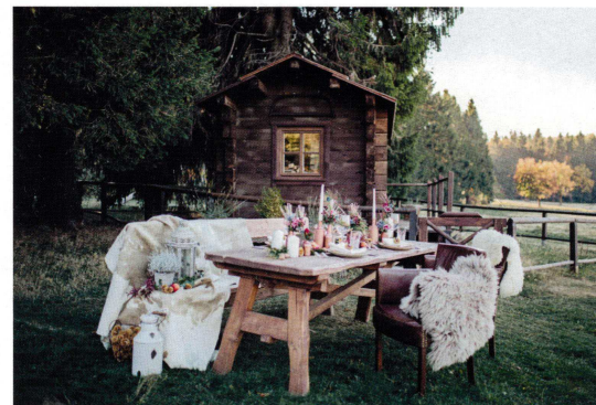
Ziemlich weit oben – kulinarischer Hochgenuss im Vogelsberg.